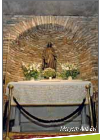
Meryem Ana Evi

Bülbül Dağı'nda Hıristiyanlığın kutsal anası Meryem Ana'nın evi bulunmaktadır. Hz. İsa, çarmıhta son nefesini vermeden önce, annesini, havarisi olan Aziz John'a emanet etmiştir. Bunun üzerine, Aziz John'un Meryem Ana'yı, Kudüs'te kalmasını sakıncalı bulduğundan, yanına alarak Efes'e geldiğine, Bülbül Dağı eteklerinde sık ağaçlarla kaplı bir köşede yaptığı kulübede gizlediğine ve Meryem Ana'nın burada öldüğüne inanılmaktadır.