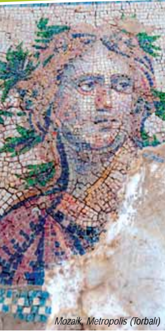
Mozaik, Metropolis (Torbali)