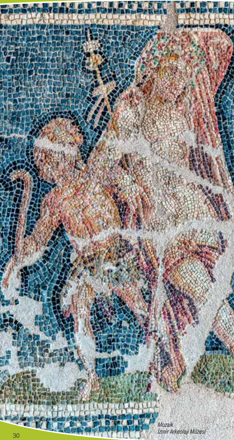
Mozaik İzmir Arkeoloji Müzesi