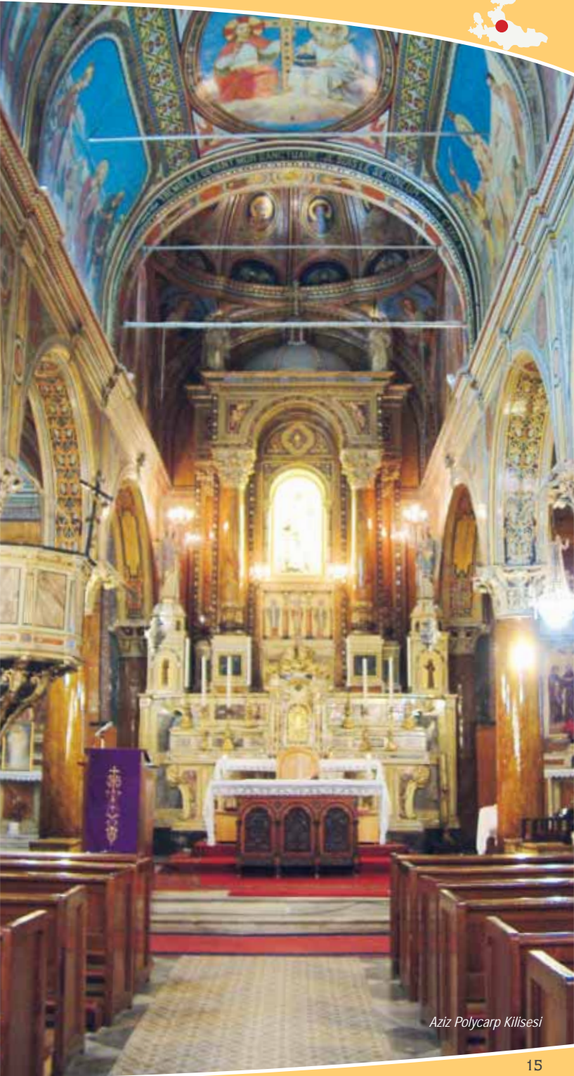
Aziz Polycarp Kilisesi