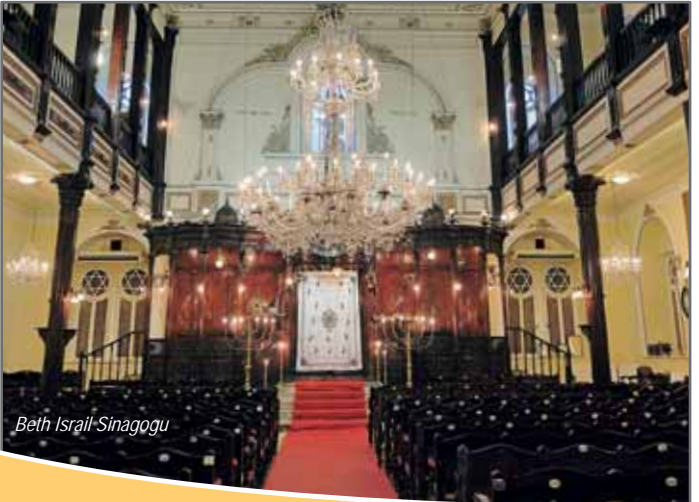
Beth Israel Sinagogu

1862 yılında yapılmaya başlanmış ve 1874 yılında hizmete girmiştir. Esas sunak, Papa 9. Pion'un armağanıdır. 1863 yılında, Sultan Abdülaziz'in bu kilisenin inşaatında kullanılmak üzere büyük miktarda altın verdiği bilinmektedir. Kilise, hem Protestan, hem de Katolik Amerikan cemaatlerince hâlen kullanılmaktadır.