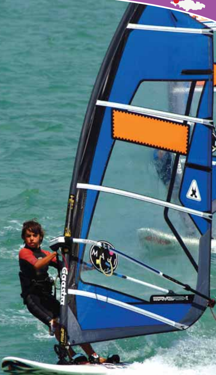
Alaçati - Sörf