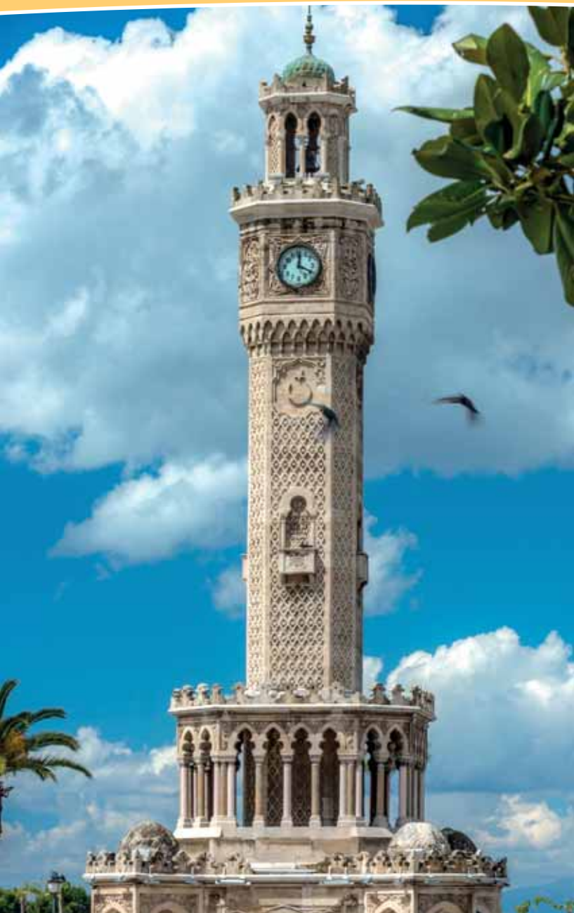
Izmir - Merkez