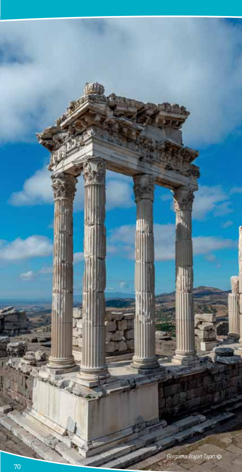
Bergama Trajan Tapınađı