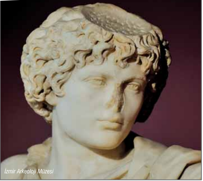
İzmir Arkeoloji Müzesi

çıkan eserlerin sergilendiği İzmir Arkeoloji Müzesi'nde, tarih öncesi çağlara ve M.Ö. 3000'li yıllara ait pişmiş toprak buluntularına yer verilmektedir.