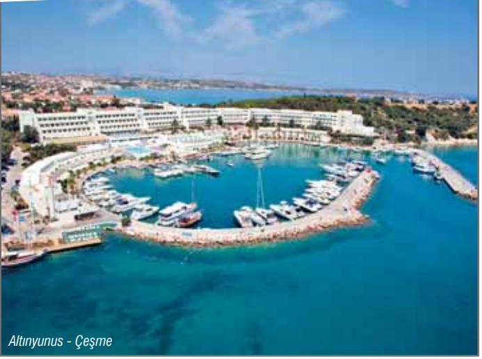
Altinyunus - Çeşme

Ören plajları, kumsal özellikleri bakımından öne çıkmaktadır. Plajlara ulaşım son derece kolaydır. İzmir merkez ve Üçkuyular garajlarından hemen her ilçeye, günün her saatinde araçla ulaşım imkânı vardır.