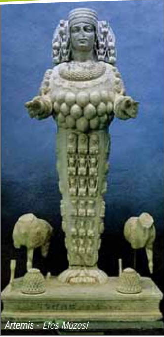
Artemis - Efes Müzesi

1,5 milyon turistin ziyaret ettiği, Türkiye'nin en önemli kültürel mirasıdır.