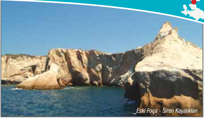
Eski Foça - Siren Kayalıkları

Erken Hıristiyanlık Dönemi'nde Bizans İmparatorluğu'nun (Thrakesion Bölgesi'nin) piskoposluk merkezi olmuştur.