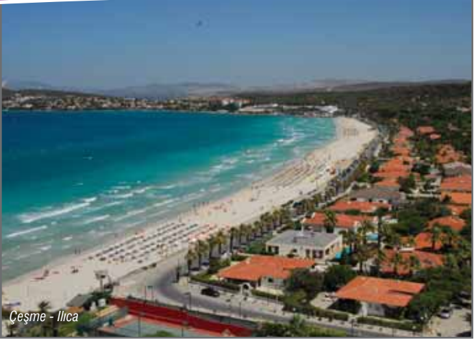
Çeşme - Ilica

Çeşme, İzmir'in en batı ucunda kendi adını taşıyan yarımada kurulmuştur.