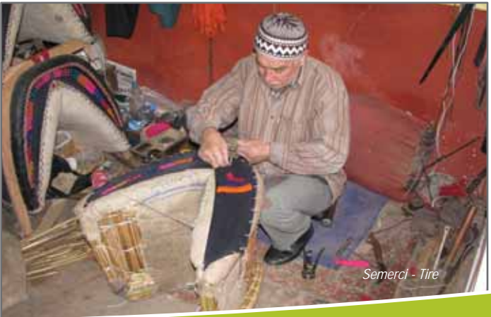
Semerci - Tire

Önemli tarihî eserler arasında, Çanakçı Mescidi, Şemsi Mescidi, Doğançıyan Zaviyesi, Kızıl Deli Baba Zaviyesi, Yeşil İmaret Zaviyesi, Karahasan Camii, Karakadı Camii, Molla Arap Camii, Paşa Camii, Ulu Camii, Yalınayak Camii,