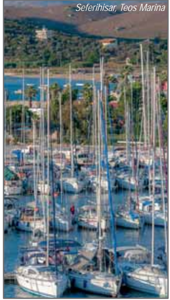
Seferihisar, Teos Marina

Anakreon (M.Ö. 6. yüzyıl) burada doğmuştur. Teos'a giderken içinden geçilen Sığacık'ta, bir 16. yüzyıl Osmanlı Kalesi bulunmaktadır. Ayrıca doğal bir liman görünümündeki Sığacık Körfezi'nde günbatımının enfes güzelliği yaşanabilir. Son yıllarda yat limanı inşa edilmiştir.