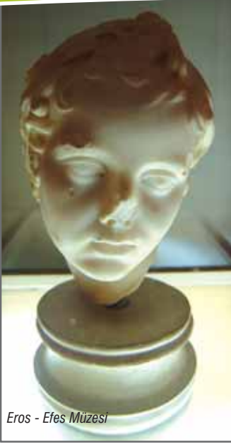
Eros - Efes Müzesi

Bundan başka, Efes ve Selçuk'ta yeni düzenlemeler yapılarak Efes Arkeoloji Müzesi'ne bağlı yeni bölümler oluşturulmuş ve ziyarete açılmıştır.