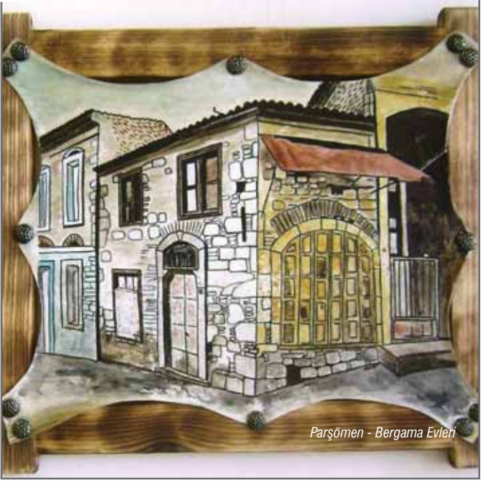
Parşömen - Bergama Evleri