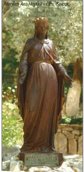
Meryem Ana Heykeli - Efes, Selçuk

1895'ten bu yana, Efes Müzesi ve Avusturya Arkeoloji Enstitüsü