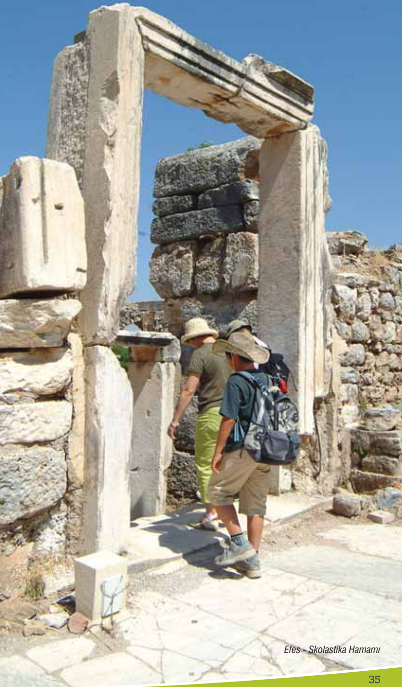
Efes - Skolastika Hamamı