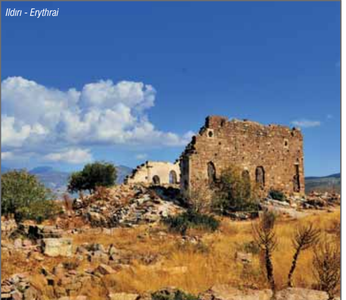
Ildırı - Erythrai

Günümüzde gözden uzak bir deniz kasabası olan Ildırı, balık lokantaları ve keyifli gün batımıyla Çeşme'nin sunduğu sakin bir köşedir.