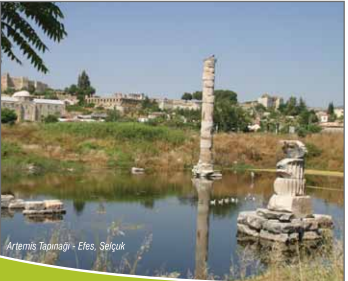
Artemis Tapınağı - Efes, Selçuk

Arkeolojik olarak ele geçen ilk buluntular, Artemision'da M.Ö. 1500'den 300'lü yıllara kadar yerleşim olduğunu göstermektedir. Burada, Tanrıça Kybele adına yapılan ilk tapınak, M.Ö. 8. yüzyıla ait olmakla birlikte, yüzyıllar boyunca birçok evrim geçirmiştir. M.Ö. 356'da, Büyük İskender'in doğduğu yılda, Herostratos adlı bir kişinin çıkardığı yangın sonucu tamamen harap olmuş, M.Ö. 330'lu yıllarda ise Efesliler kendileri için çok önemli gördükleri Artemis Tapınağı'nı aynı planın üzerinde ama eskisinden çok daha gösterişli biçimde inşa etmişlerdir.