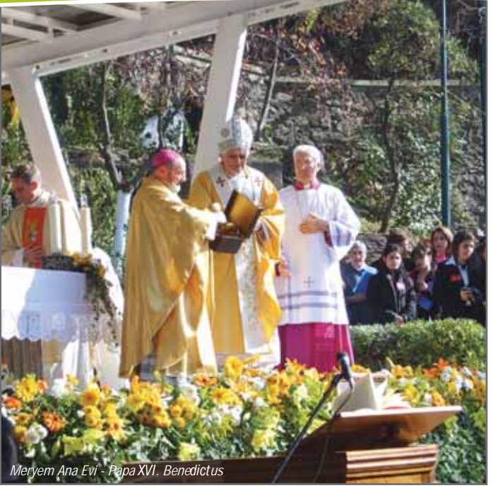
Meryem Ana Evi - Papa XVI. Benedictus