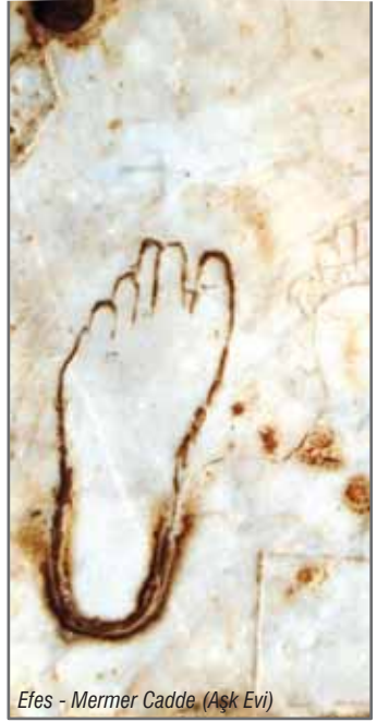
Efes - Mermer Cadde (Aşk Evi)