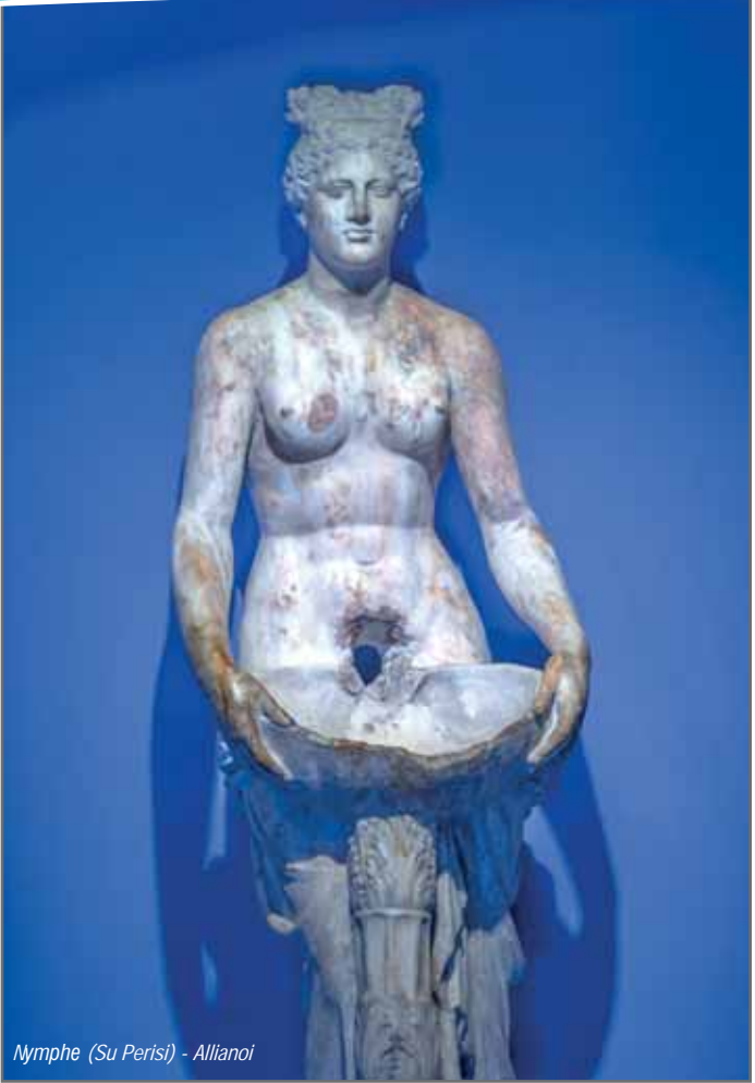
Nymphe (Su Perisi) - Alliano

11. yüzyıla kadar aralıksız olarak kullanılmıştır. Buradaki Roma köprüsü ve hamamı hâlen ayaktadır.