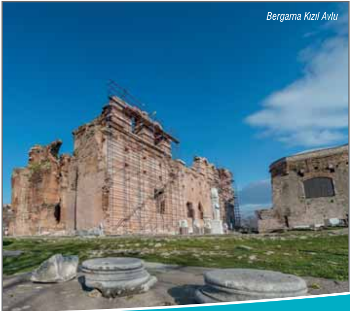
Bergama Kızıl Avlu

Kaplıcada su sıcaklığı 35 °C dolayındadır. İçinde sodyum bikarbonat ve sülfat bulunan kaplıca suyu, romatizma, nevralsi ve kalp hastalıklarına iyi gelmektedir. Tarihte, Kleopatra'nın Bergama'yı ziyaretinde bu kaplıcada yıkanarak güzelleştiği rivayet edilir.