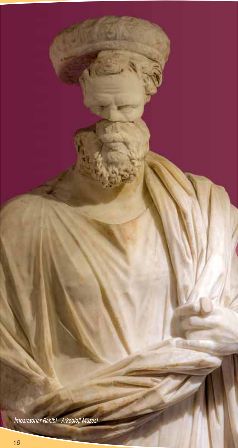
İmparatorlar Rahibi - Arkeoloji Müzesi