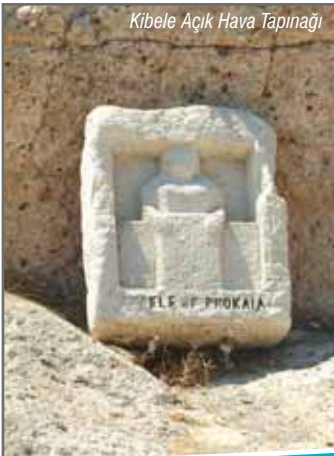
Kibele Açık Hava Tapınağı

Fok balıklarını andıran adacıklardan oluşan bu kayalıkların en büyüğü Orak Adası kayalıklarıdır. Homeros Destanı'nda bu yerden "yolunu şaşırان gemilerin çarptıkları kayalıklar" olarak söz edilir.