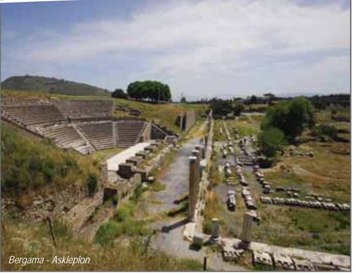
Bergama - Asklepiyon

yüzyıldaki büyük depremle yapılar tahrip olmuştur. Hıristiyanlığın yayılmasıyla Asklepiyon Tapınağı kilise olarak kullanılmıştır.