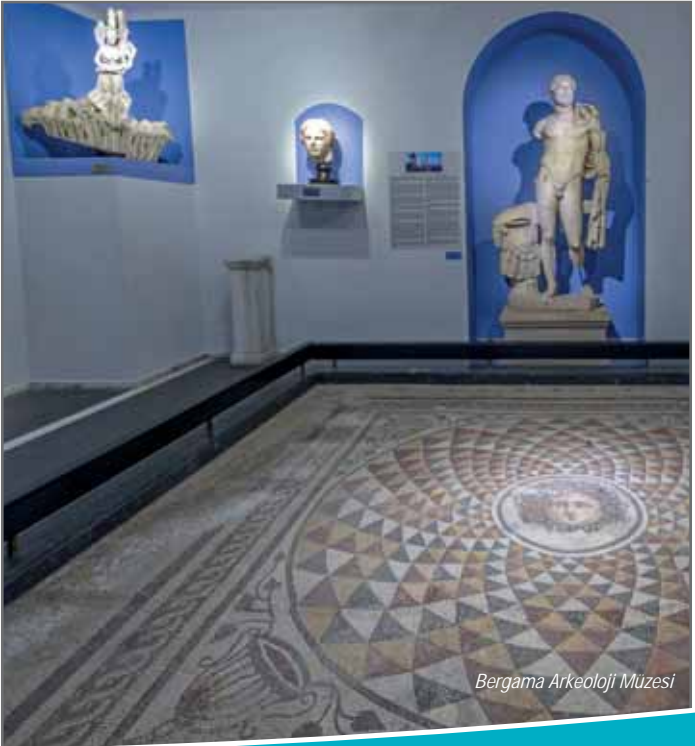
Bergama Arkeoloji Müzesi

Allianoı Sağlık Merkezi, yöredeki sıcak su nedeniyle Bergama'nın 18 km. kuzeydoğusunda kurulmuştur. Yortanlı Barajı yatağında bulunan antik merkezde sürdürülen kazı çalışmalarıyla arkeolojik eserler kurtarılmaya çalışılmaktadır. Güncelliğini koruyan kazılar, paha biçilemeyen "Nimphe Heykeli'nin- Su Perisi" bulunmasıyla kentin önemine yeni bir boyut kazandırmıştır. Ege havzasındaki sayılı sağlık merkezlerden biri kabul edilen Allianoı'de hidroterapi (su ile tedavi) yapıldığı bilinmektedir. M.Ö. 2. yüzyılda küçük bir sağlık merkezi, belki de bir kült olarak kullanılan Allianoı, 2. yüzyılda Roma İmparatoru Hadrianus ile birlikte görkemli bir yerleşim ve sağlık merkezi hâline gelmiştir.