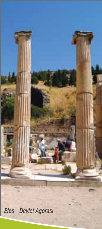
Efes - Devlet Agorası

Ticari Agora'nın yanında bulunan Celsus Kütüphanesi, 115 yıllarında Asya Konsülü Julius Aguilä tarafından babası Celsus adına yaptırılmıştır. Kütüphane, Mısır'daki İskenderiye ve Anadolu'daki Bergama Kütüphanelerinden sonra Klasik Dönem'de dünyanın en büyük üçüncü kütüphanesiydi. Arka duvardaki bir kapıdan Celsus'un mezarına geçilir. Celsus'un burada bulunan heykeli, günümüzde İstanbul Arkeoloji Müzesi'nde sergilenmektedir. Roma'nın mimari özelliklerini tümüyle yansıtan yapının ön cephe dekorasyonu, döneminin en güzel örnekleri arasında yer alır. Ön cephe kolonları arasında yer alan dört kadın heykeli ile Celsus'un kişisel erdemleri sayılan Bilgelik (Sophia), Karakter (Arete), Yargılama Gücü (Ennoia) ve Deneyim (Episteme) betimlenir.